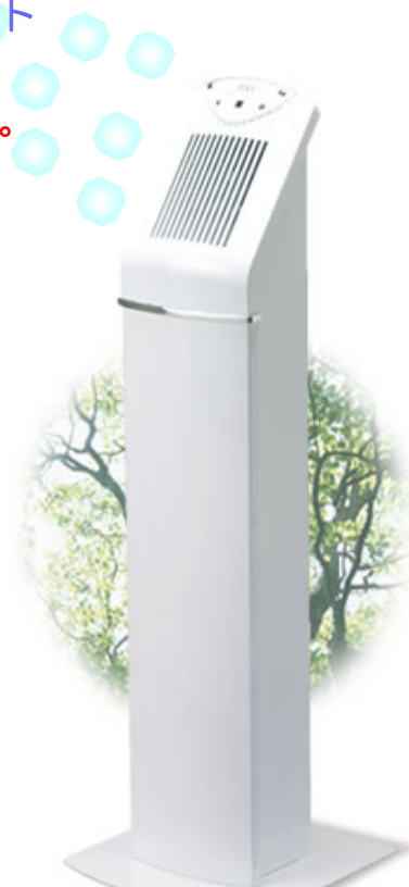
環境改善型香り発生機